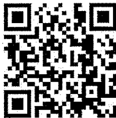
เว็บไซต์สำนักงานฯ

โทรศัพท์ ๐ ๗๔๒๕ ๒๔๕๗-๘ โทรสาร ๐ ๗๔๓๒ ๔๒๓๘